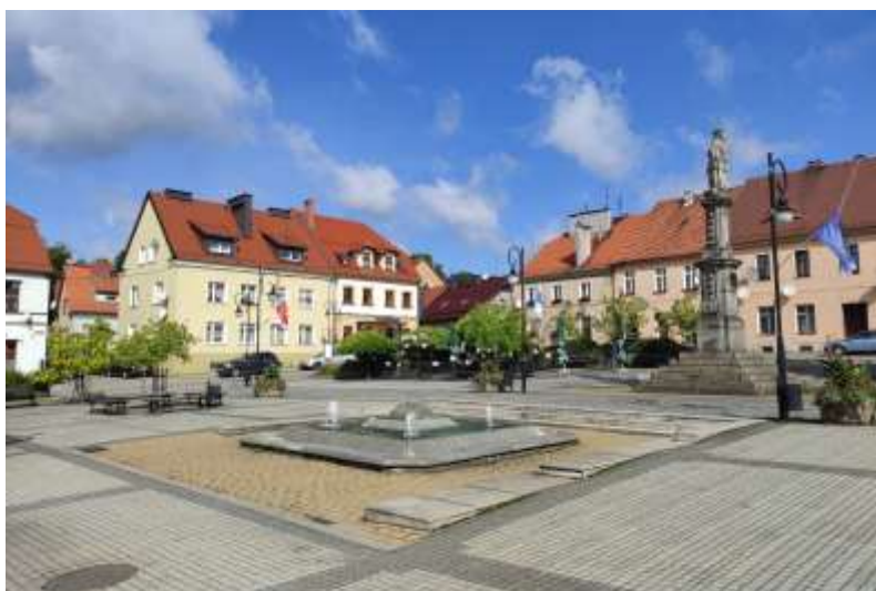
Zdjęcia nr 1, 2. Rynek w Toszku, źródło: archiwum własne, Jakub Danielski