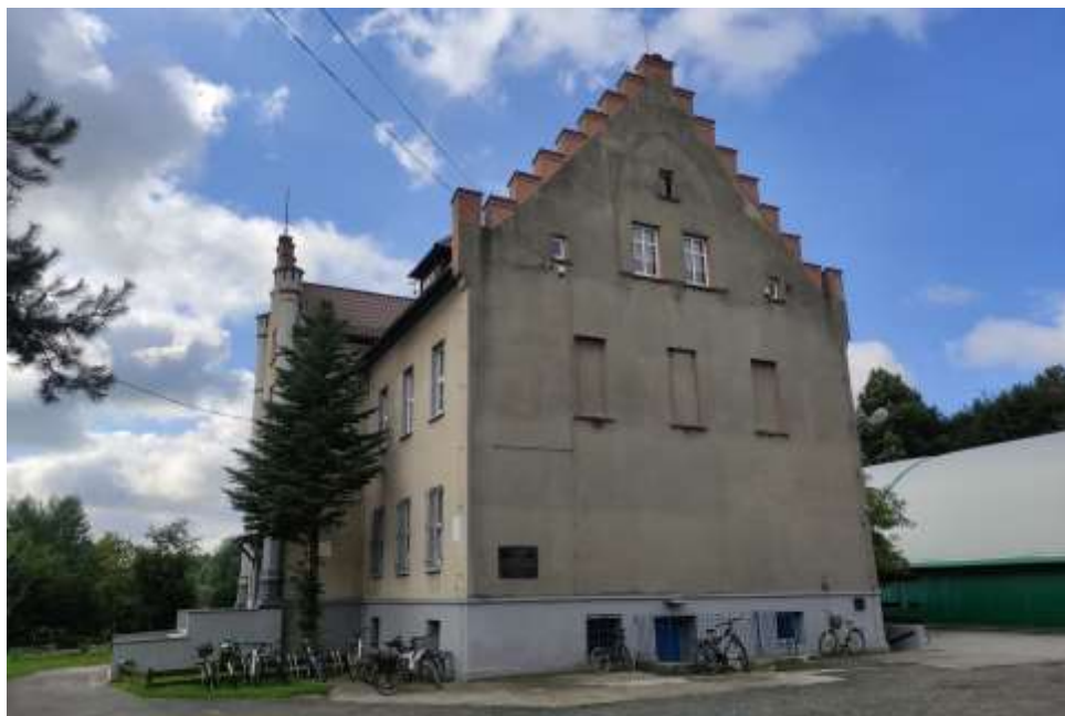
Zdjęcia nr 50, 51. Pałac w Kotulinie