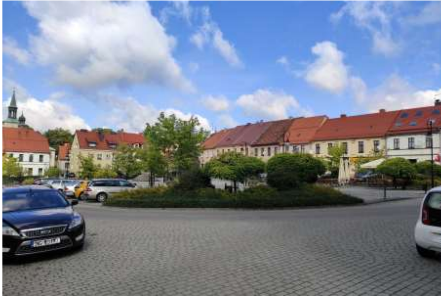
Zdjęcie nr 54. Zabudowa Rynku w Toszku, źródło: archiwum własne, Jakub Danielski