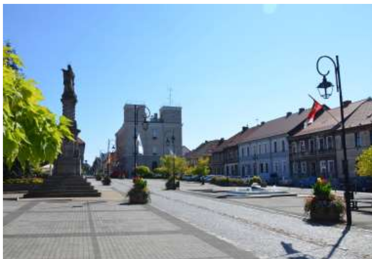
Zdjęcie nr 5. Widok na Urząd Miasta w Toszku