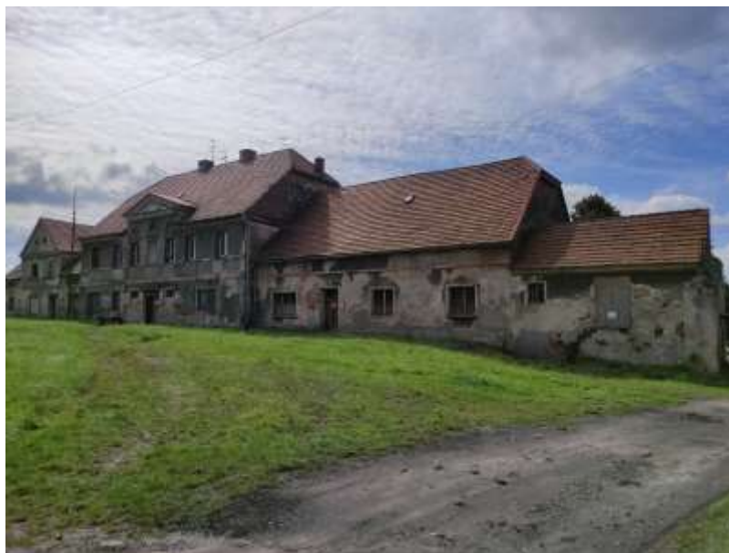
Zdjęcie nr 46. Dwór w Paczynie

Klasycystyczny dwór w Paczynie powstał ok. 1820 r. Prostokątna, dwutraktowa budowla z osiową sienią i salonem ogrodowym, połączona jest z dwiema oficynami. We wnętrzach zachowały się pozostałości klasycystycznego wystroju. Dworowi towarzyszą zabudowania dworskie, tworząc wraz z nim zespół zabudowy. Obiekty mocno zaniedbane, znajdują się w bardzo złym stanie technicznym.