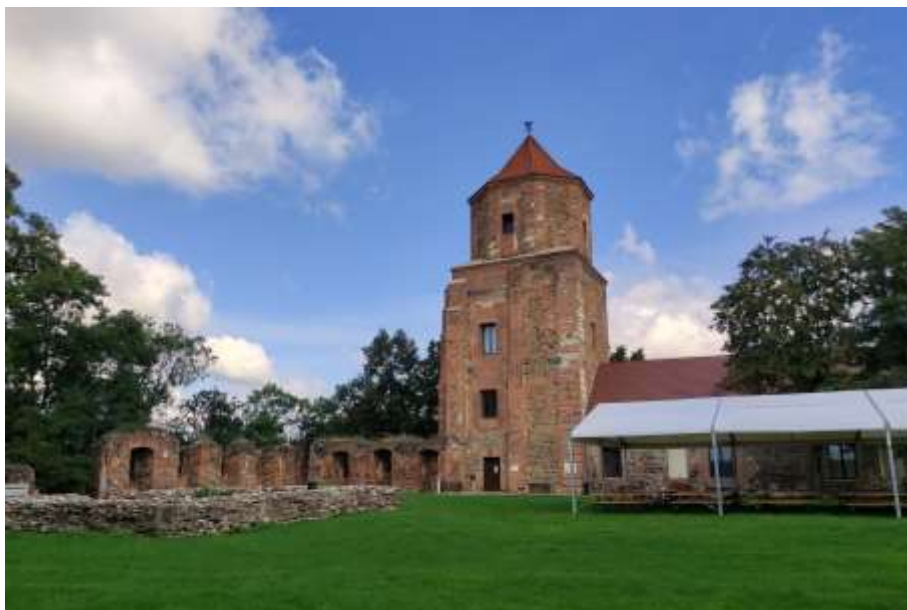
Zdjęcie nr 10. Zamek w Toszku – baszta, źródło: archiwum własne, Jakub Danielski

Najbardziej znanym obiektem zabytkowym ziemi toszeckiej jest zespół zamkowy. Ruiny zamku w Toszku usytuowane są na wzgórzu na zachód od starego miasta. Zamek wzniesiony został na przełomie XIV i XV w. w miejscu XII-wiecznego grodu drewnianego. Budowla przechodziła burzliwe koleje losu – zniszczona w wyniku nawały husyckiej, odbudowana została w latach 1433-1480 przez księcia opolskiego Przemysława, po raz kolejny została odbudowana po pożarze i przekształcona w rezydencję nowożytną przez Kaspera hr. Colonnę w latach 1650-1666. W późniejszych latach zamek stanowił własność Posadowskich i Adolpha v. Eichendorffa, ojca poety Josepha. Od czasu pożaru w 1811 r. pozostaje w ruinie. Zamek gotycki, z elementami renesansowymi i barokowymi, na nieregularnym rzucie o owalnym narysie murów. Zachował się budynek bramny i budynek mieszkalny z istniejącą basztą północną oraz stajnią, a po stronie wschodniej – nowożytne fortyfikacje na rzucie trapezu z czterema bastejami, bramą i pozostałościami wcześniejszej fosy. Przy bramie, połączony z basteją, znajduje się tzw. „dom burgrabiego”.