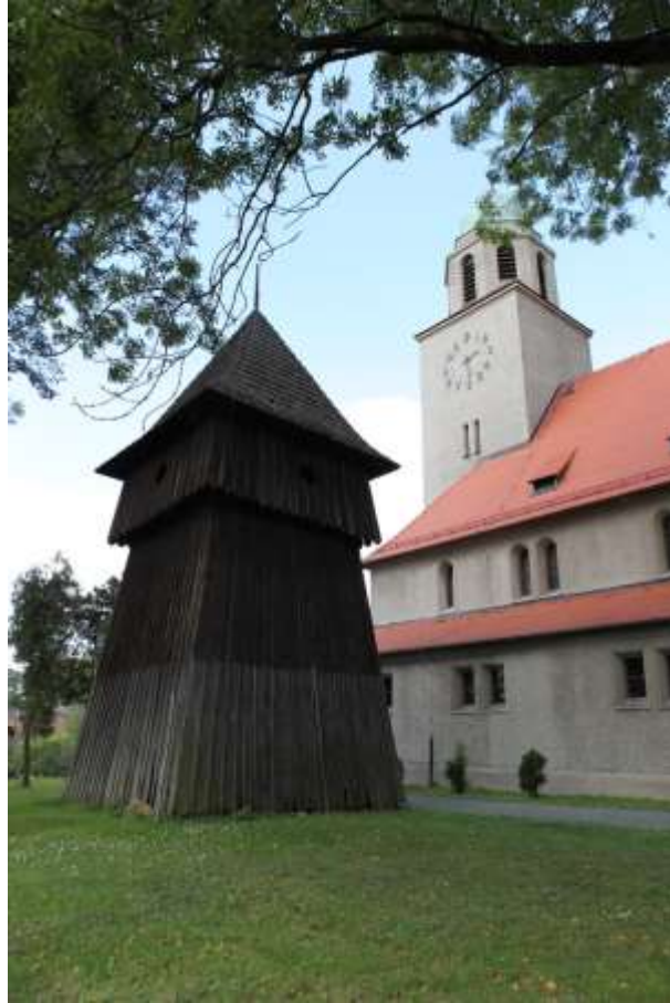
Zdjęcie nr 32. Dzwonnica i kościół pw. św. Marcina w Paczynie

Warto wspomnieć o klasztorze sióstr Boromeuszek w Toszku. Zgromadzenie Sióstr Miłosierdzia św. Karola Boromeusza powstało we Francji w XVII w. dla niesienia miłosiernej posługi ludziom chorym, ubogim i potrzebującym. W XIX w. przybyły na Śląsk, do Nysy, Siostry ze Zgromadzenia św. Karola Boromeusza dotarły do Toszka w 1901 r. W 1911 r., przy głównej drodze w Toszku, (obecnie ul. Strzelecka) w pobliżu kościoła ewangelickiego (ruiny tego kościoła zostały rozebrane w latach 80-tych) zbudowany został Dom św. Józefa dla Sióstr Boromeuszek. Od tego czasu elewacja zewnętrzna budynku praktycznie się nie zmieniła. Na dachu nadal widnieje metalowy krzyż, mury są szare. Obecnie budynek dawnego klasztoru tylko częściowo związany jest z kościołem.