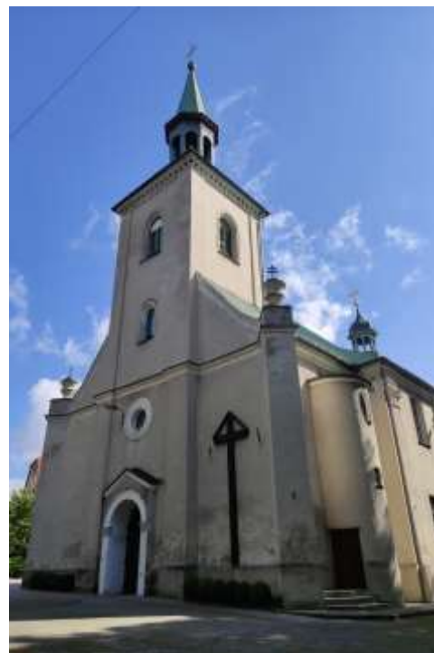
Zdjęcia nr 18, 19. Kościół parafialny pw. św. Katarzyny Aleksandryjskiej w Toszku