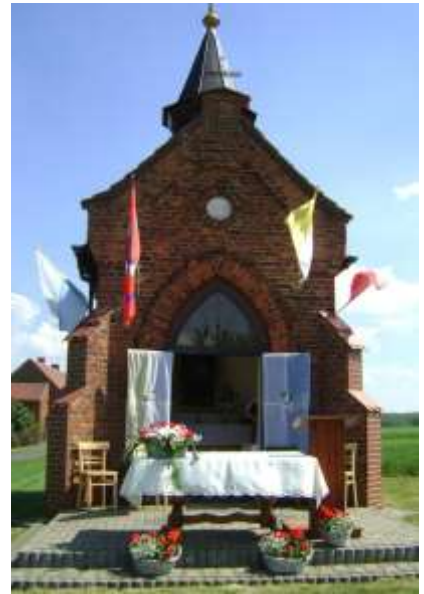
Zdjęcia nr 35, 36, 37. Kapliczki w Ciochowicach, Piszowicach i w Wilkowiczkach, źródło: archiwum Urzędu Miejskiego w Toszku