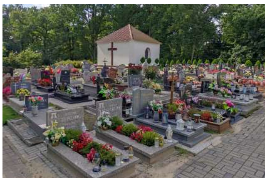
Zdjęcie nr 40. Cmentarz rzymsko-katolicki w Pniowie