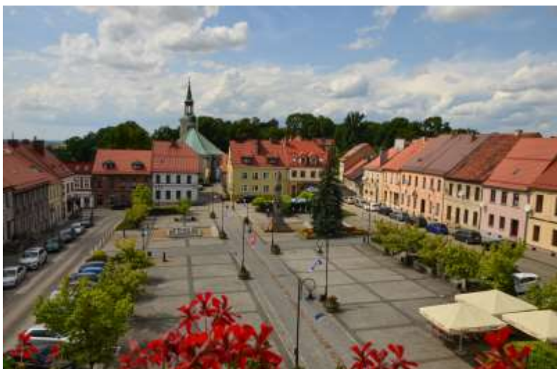
Zdjęcie nr 3. Widok na rynek w Toszku, źródło: archiwum Urzędu Miejskiego w Toszku