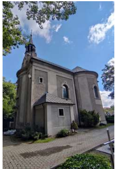
Zdjęcia nr 24, 25. Kościół pw. świętej Barbary w Toszku, źródło: archiwum własne, Jakub Danielski