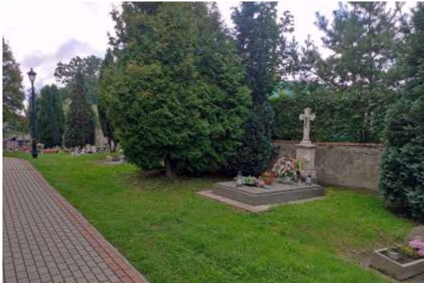
Zdjęcia nr 42, 43. Cmentarz przykościelny w Kotulinie, źródło: archiwum własne, Jakub Danielski