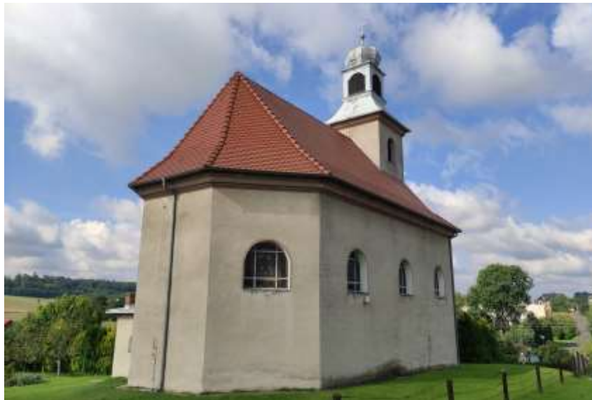
Zdjęcia nr 26, 27. Kaplica pw. św. Anny w Ligocie Toszeckiej