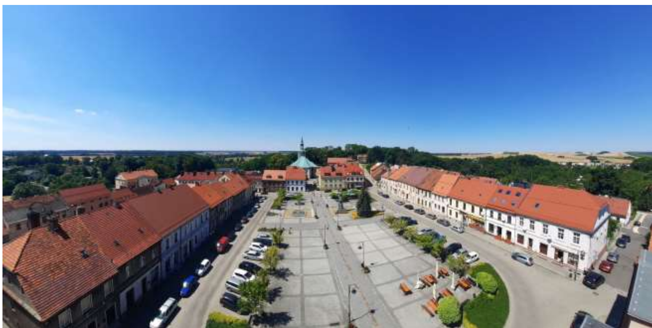
Zdjęcie nr 4. Widok na cały rynek w Toszku