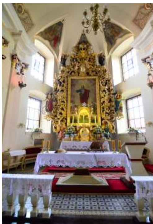
Zdjęcia nr 20, 21. Ambona i ołtarz główny w kościele parafialnym pw. św. Katarzyny Aleksandryjskiej w Toszku