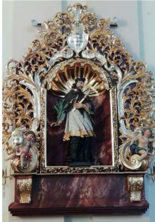
Zdjęcia nr 22, 23. Ołtarze boczne w kościele parafialnym pw. św. Katarzyny Aleksandryjskiej w Toszku

Drugą budowlą sakralną Toszka jest późnobarokowy kościół cmentarny pw. św. Barbary, zbudowany z fundacji hr. Fr. Kotulińskiego, między 1720 a 1750 r. Kościół uległ spaleniu w 1833 r., a odbudowany został w 1849 r. Budowla sklepiona, prezentuje ciekawy rzut, z prostokątną nawą i trójlistną częścią wsch.