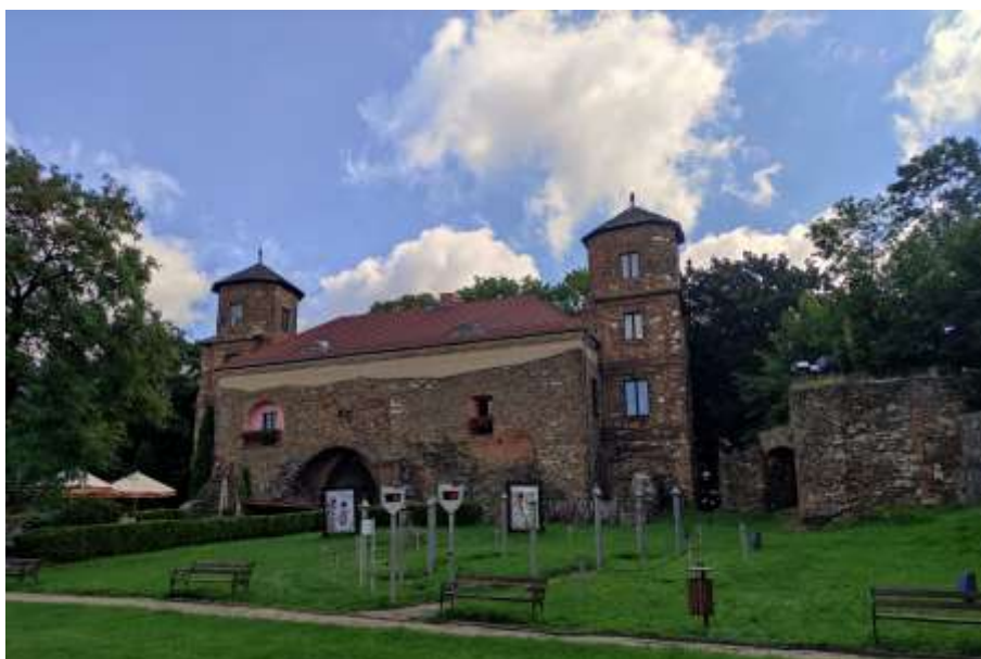
Zdjęcia nr 8, 9. Zamek w Toszku – budynek bramny, źródło: archiwum własne, Jakub Danielski