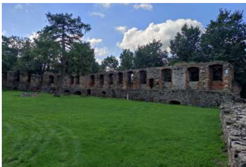
Zdjęcie nr 11. Zamek w Toszku – mury, źródło: archiwum własne, Jakub Danielski

Najbardziej znanym obiektem zabytkowym ziemi toszeckiej jest zespół zamkowy. Ruiny zamku w Toszku usytuowane są na wzgórzu na zachód od starego miasta. Zamek wzniesiony został na przełomie XIV i XV w. w miejscu XII-wiecznego grodu drewnianego. Budowla przechodziła burzliwe koleje losu – zniszczona w wyniku nawały husyckiej, odbudowana została w latach 1433-1480 przez księcia opolskiego Przemysława, po raz kolejny została odbudowana po pożarze i przekształcona w rezydencję nowożytną przez Kaspera hr. Colonnę w latach 1650-1666. W późniejszych latach zamek stanowił własność Posadowskich i Adolpha v. Eichendorffa, ojca poety Josepha. Od czasu pożaru w 1811 r. pozostaje w ruinie. Zamek gotycki, z elementami renesansowymi i barokowymi, na nieregularnym rzucie o owalnym narysie murów. Zachował się budynek bramny i budynek mieszkalny z istniejącą basztą północną oraz stajnią, a po stronie wschodniej – nowożytne fortyfikacje na rzucie trapezu z czterema bastejami, bramą i pozostałościami wcześniejszej fosy. Przy bramie, połączony z basteją, znajduje się tzw. „dom burgrabiego”.