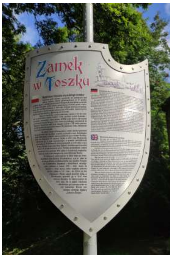
Zdjęcie nr 15. Tablica informacyjna przy zamku w Toszku