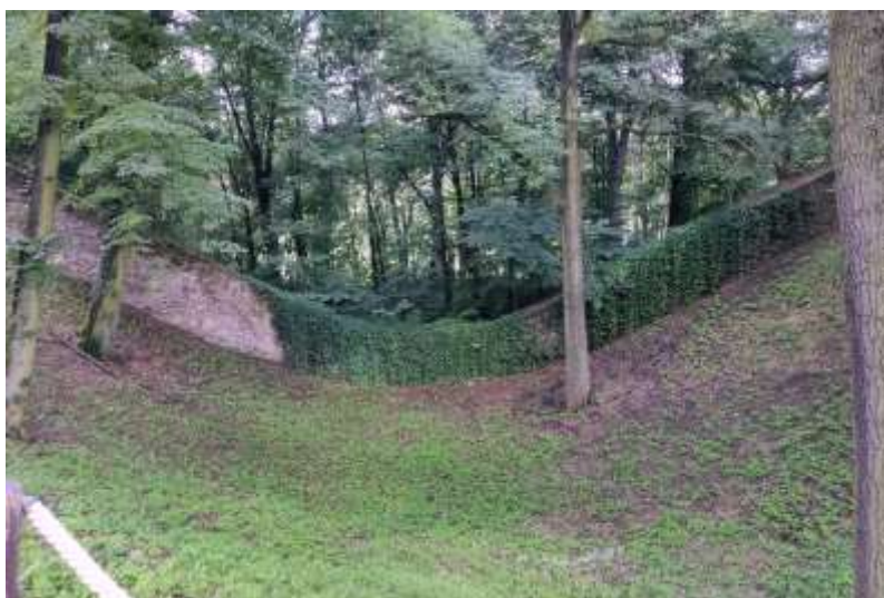
Zdjęcie nr 7. Fosa przy zamku