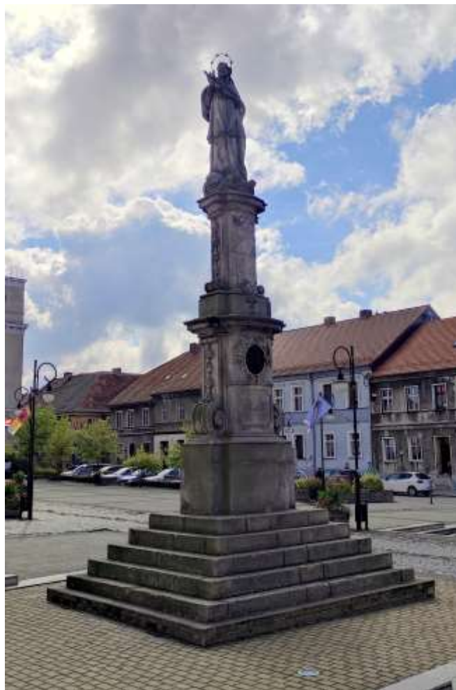
Zdjęcie nr 55. Figura św. Jana Nepomucena na Rynku w Toszku, źródło: archiwum własne, Jakub Danielski