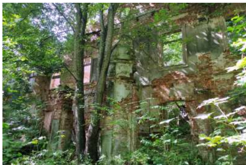
Zdjęcie nr 47. Ruiny pałacu w Pniowie, źródło: archiwum własne, Jakub Danielski

Pałac w Pniowie wybudował generał H.B. von Gröling w 1770 r. Barokowa budowla była rozbudowywana w XIX w. Wzniesiono ją na rzucie prostokąta, z sienią na osi, była dwuipółtraktowa, w części pomieszczeń sklepiona. Pałac otoczony był parkiem krajobrazowym, którego istotnym elementem kompozycyjnym była przecinająca teren parkowy rzeka. Na terenie parku znajdowało się mauzoleum rodu v. Gröling. Pałac został uszkodzony w trakcie działań wojennych w 1945 r. Pozostaje w stanie ruiny.