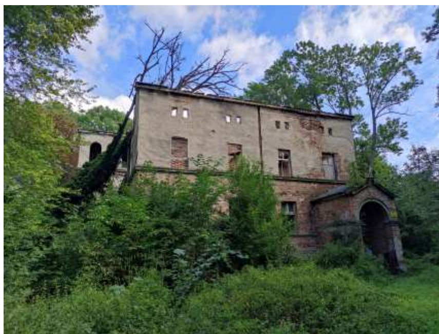
Zdjęcia nr 48, 49. Pałac w Kotliszowicach, źródło: archiwum własne, Jakub Danielski