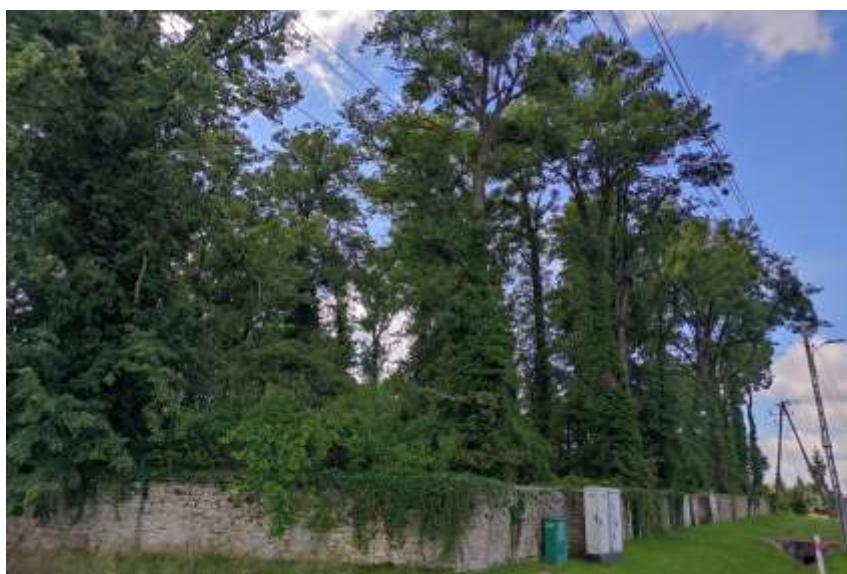
Zdjęcia nr 44, 45. Cmentarz żydowski w Toszku