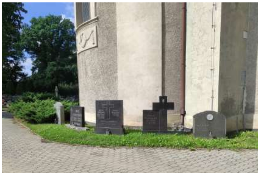
Zdjęcie nr 39. Cmentarz parafialny w Toszku