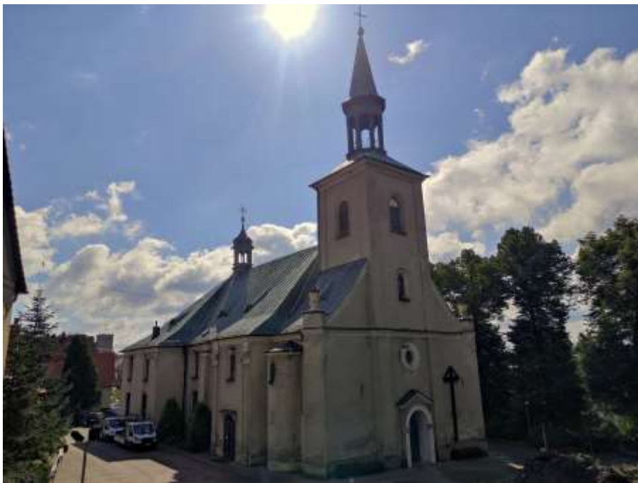
Zdjęcia nr 16, 17. Kościół parafialny pw. św. Katarzyny Aleksandryjskiej w Toszku, źródło: archiwum własne, Jakub Danielski