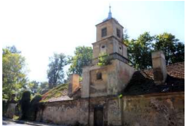
Zdjęcia nr 33, 34. Dom Bractwa Strzeleckiego w Toszku