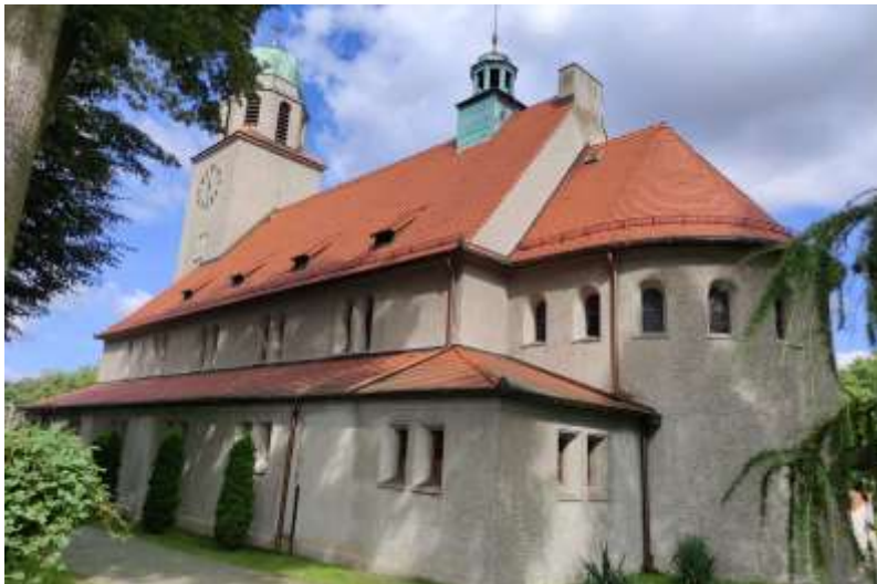
Zdjęcia nr 30, 31. Kościół pw. św. Marcina w Paczynie