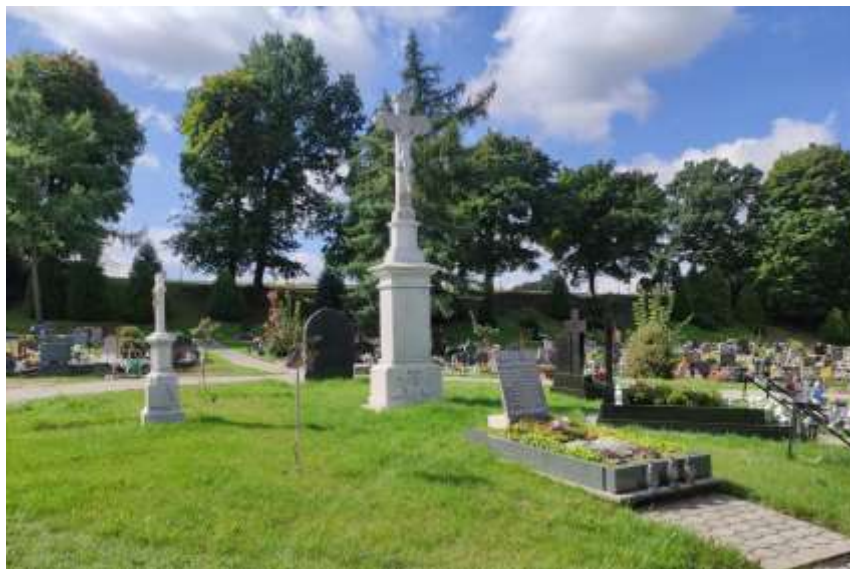
Zdjęcie nr 38. Cmentarz parafialny w Toszku

W Toszku, oprócz katolickiego cmentarza parafialnego, istnieje także cmentarz komunalny, dawniej ewangelicki. W miejscowościach Paczyna i Pniów znajdują się cmentarze rzymsko-katolickie. Cmentarz przykościelny znajduje się także w Kotulinie.