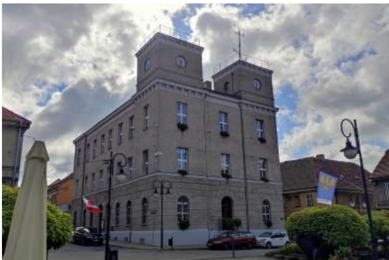
Zdjęcie nr 6. Ratusz w Toszku, Zdjęcia nr 1, 2. Rynek w Toszku, źródło: archiwum własne, Jakub Danielski