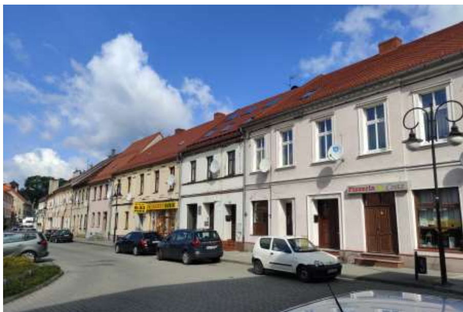
Zdjęcia nr 52, 53. Zabudowa Rynku w Toszku