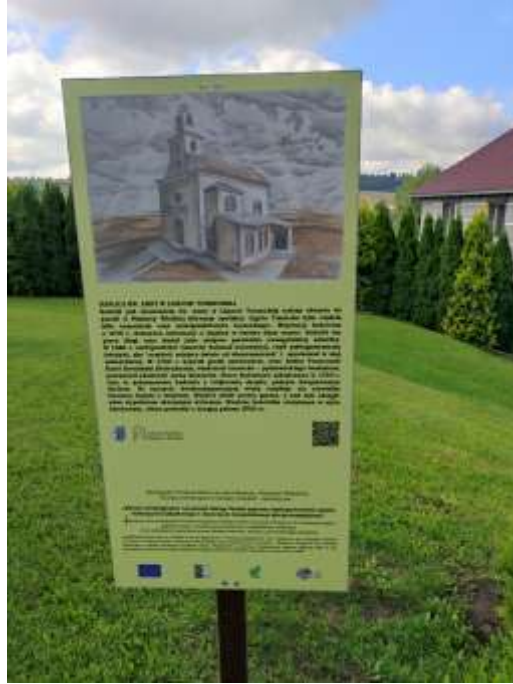
Zdjęcia nr 28, 29. Kaplica pw. św. Anny w Ligocie Toszeckiej