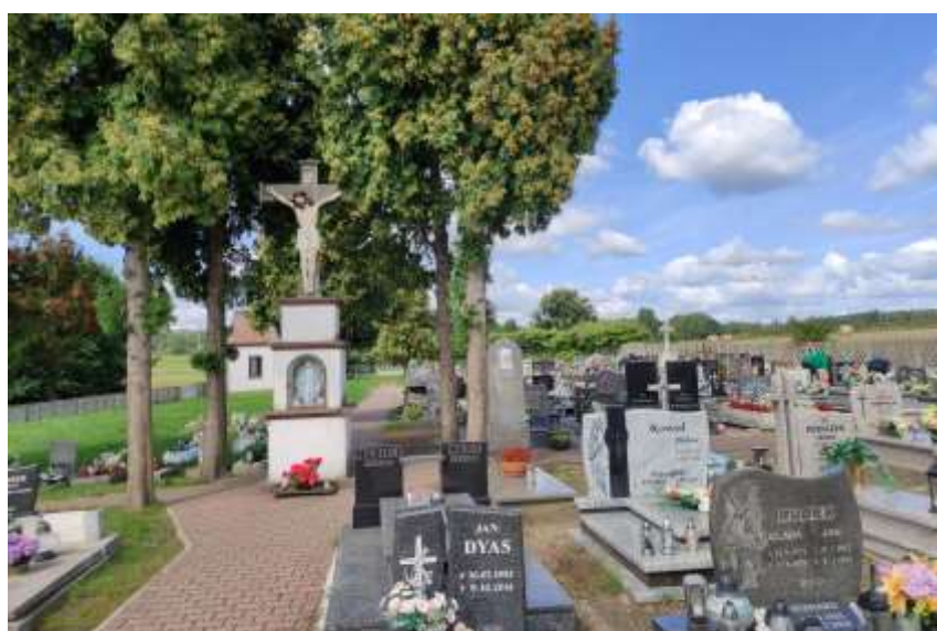
Zdjęcie nr 41. Cmentarz rzymsko-katolicki w Paczynie