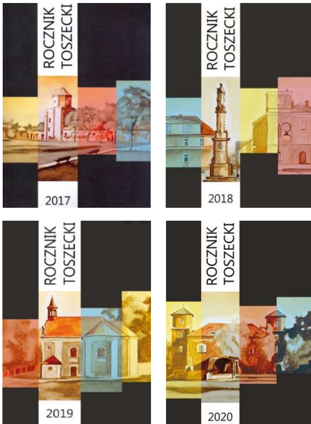
Rysunki nr 2, 3, 4, 5. Roczniki Toszeckie, źródło: www.toszek.pl

W gminie od 2017 r. wydawane są „Roczniki Toszeckie”, które mogą przyczynić do popularyzacji wiedzy o dziedzictwie kulturowym Toszka, wpłynąć pozytywnie na więzi lokalnej społeczności oraz kształtować poczucie tożsamości lokalnej.