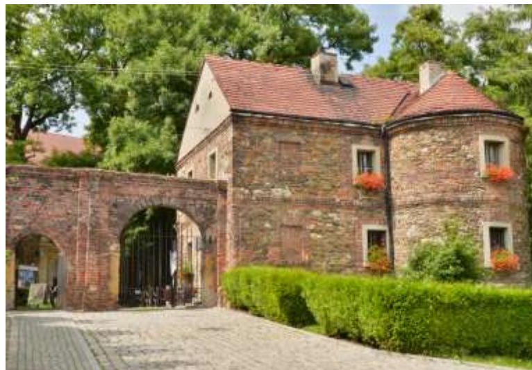
Zdjęcie nr 14. Zamek w Toszku, źródło: archiwum Urzędu Miejskiego w Toszku