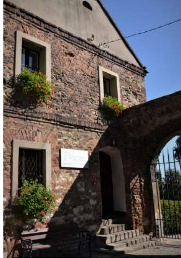
Zdjęcia nr 12, 13. Zamek – budynek bramny